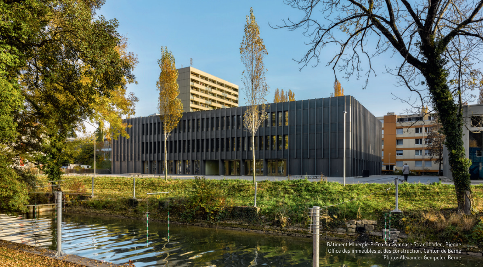
Bâtiment Minergie-P-Eco du Gymnase Strandboden, Bienne Office des immeubles et des constructions, Canton de Berne