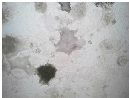
Abbildungen 2 und 3: Starker Schimmelbewuchs kann zu gesundheitlichen Problemen führen.