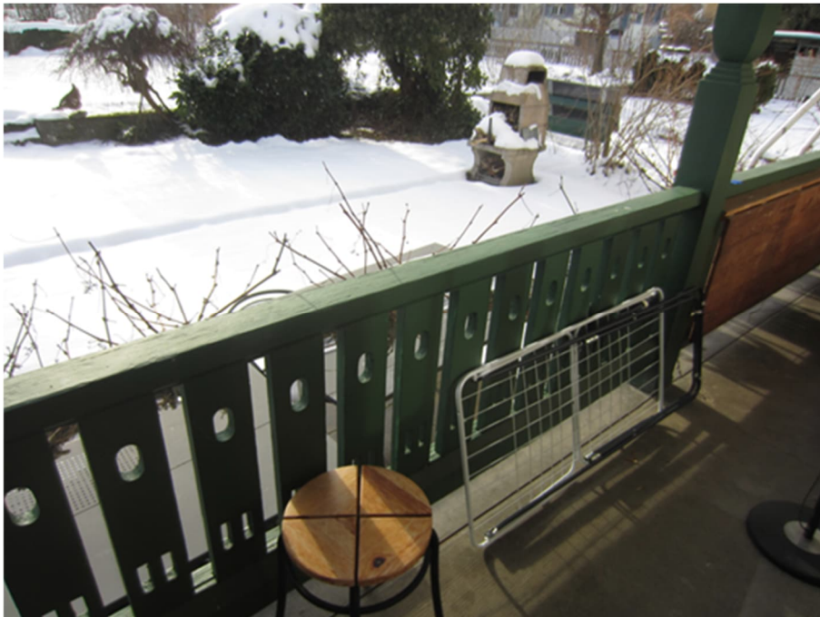
Abbildung 1: Häufige Anwendung von Bleifarben bei wetter-exponierten Holzanstrichen