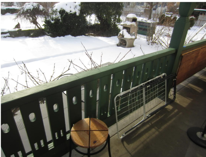
Abbildung 1: Häufige Anwendung von Bleifarben bei wetter-exponierten Holzanstrichen