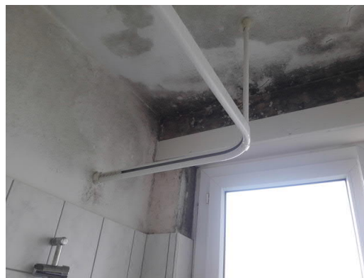
Abbildung: Starker Schimmelbewuchs kann zu gesundheitlichen Problemen führen